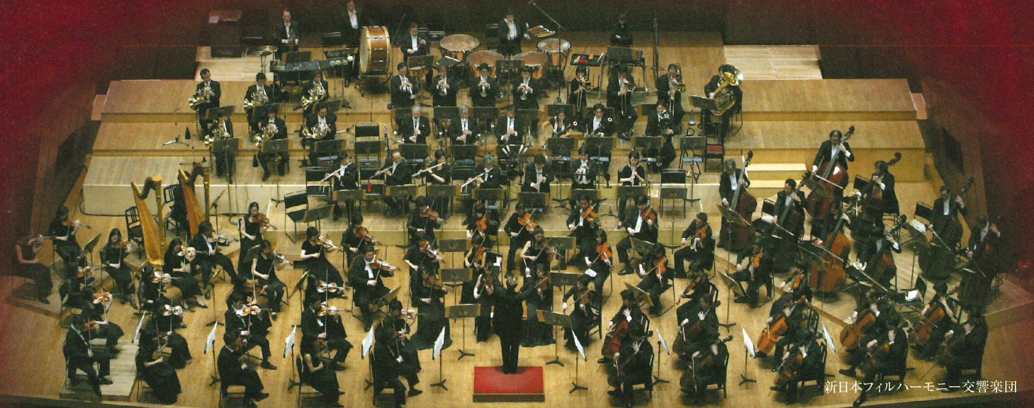
新日本フィルハーモニー交響楽団

【チケット料金】 S ¥3,500 A ¥2,500 B ¥1,500 車椅子 ¥3,500