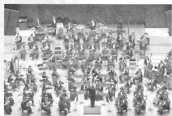
新日本フィルハーモニー交響楽団 New Japan Philharmonic