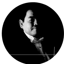
指揮 下野竜也 Tatsuya Shimono

1969年鹿児島生まれ。2000年東京国際音楽コンクール(指揮)優勝と齋藤秀雄賞受賞、2001年プザンソン国際青年指揮者コンクールの優勝で一躍脚光を浴び、以降、国際的な活動を展開。国内の主要オーケストラに定期的に招かれる一方、ミラノ・ヴェルディ響、ストラスブルフィル、ボルドー管、ロワール管、ウィーン室内管など各国のオーケストラに次々と客演を重ね、2009年はローマ・サンタ・チェチーリア管、チェコフィルハーモニーの定期演奏会に招かれ好評を博した。2010年3月にはシュツットガルト放響へのデビューを飾り、今後はカンヌPACA管との再客演、南西ドイツフィルへのデビューが決定している。2006年に読売日本交響楽団の初代正指揮者に迎えられる、ヒンデミットとドボルザークを軸としつつ新作初演まで取り組む意欲的な姿勢とプログラム構成には特に定評がある。サイトウ・キネン・フェスティバル本木をはじめ、数多くの音楽祭にも参加。2007年からは上野学園大学音楽・文化学部教授も務めるなど後進の指導にも情熱を注いでいる。