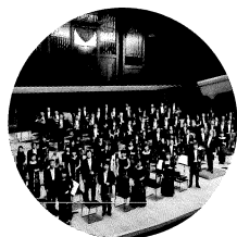
新日本フィルハーモニー交響楽団

1972年、指揮者・小澤征爾のもと楽員による自主運営のオーケストラとして創立。1997年より墨田区・すみだトリフォニーホールを本拠地とし定期演奏会などを行う他、地域に根ざした演奏活動も特徴的。2003年よりクリスティアン・アルミンクが音楽監督に就任。2009年『七つの封印を有する書』で第18回三菱UFJ信託音楽賞受賞、2006年『火刑台上のジャンヌ・ダルク』で奨励賞受賞。また2009年「ハイドン・プロジェクト」(指揮: フランス・ブリュッヘン)で第22回ミュージック・ペンクラブ音楽賞受賞。2011年2月に「ベートーヴェン・プロジェクト」を開催予定。2010/2011シーズンより、ダニエル・ハーディングがMusic Partner of NJPとして指揮者陣に加入。この他「新日本フィル・ワールド・ドリーム・オーケストラ」(音楽監督: 久石譲)の評価・人気も高い。映画『崖の上のポニョ』等では管弦楽を担当。メディアでは「日本のオーケストラ新御三家のひとつ」として紹介されている。