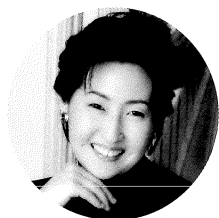
ハープ 吉野直子 Naoko Yoshino

吉野直子は今日、世界のハープ界で最も注目されている逸材である。6歳よりロサンゼルスでスーザン・マクドナルド女史のもとでハープを学び、1981年に第1回ローマ国際ハープ・コンクール第2位入賞。1985年には第9回イスラエル国際ハープ・コンクールに参加者中最年少で優勝し、国際的キャリアの第一歩を踏み出した。以後、ベルリン・フィル、イスラエル・フィル、フィラデルフィア管、ウィーン・コンツェントウス・ムジクス等トップ・オーケストラ、小澤、アーノンクール、プーレーズ、アパド他世界的指揮者との共演、ザルツブルク、ルツェルン他主要音楽祭への参加など華やかに活躍。2003年よりアパドの呼びかけによって世界トップ・クラスのソリスト達で結成されたルツェルン祝祭管弦楽団にも参加。1985年アリオン賞、1987年村松賞、1988年芸術祭賞、1989年モービル音楽賞奨励賞、1991年文化庁芸術選奨文部大臣新人賞、エイボン女性芸術賞を受賞。