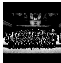
新日本フィルハーモニー交響楽団 管弦楽 New Japan Philharmonic

1972年指揮者・小澤征爾のもと楽員による自主運営のオーケストラとして創立。すみだトリフォニーホールを本拠地とし定期演奏会その他、地域に根ざした演奏活動も特徴的。99年小澤征爾が桂冠名誉指揮者に就任。2003～2013年はクリスティアン・アルミンクが音楽監督を務めた。2010-2011シーズンよりダニエル・ハーディングが「Music Partner of NJP」を務めている。2013年9月から2年間、インゴ・メッツマッハーがConductor in Residenceに就任した。受賞歴に三菱UFJ信託音楽賞(09年、アルミンク指揮)、ミュージック・ベンクラブ音楽賞(09年、ブリュッヘン指揮)等。その他2004年に音楽家・久石譲と立ち上げた「新日本フィル・ワールド・ドリム・オーケストラ」で幅広い人気を集めているほか、映画『千と千尋の神隠し』『ハウルの動く城』『崖の上のポニョ』では管弦楽を担当。2016年9月より上岡敏之が音楽監督に就任することが決定、それに先立ち、2015年4月よりアーティストック・アドヴァイザーに就任している。